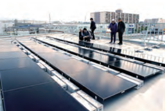
工場の屋上に並んだ太陽光パネル