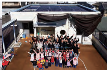
保育園におひさま発電所ができた！