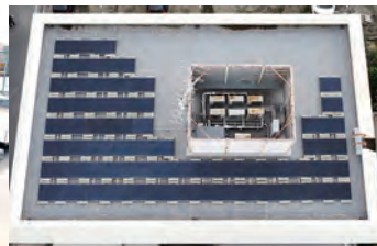
屋上の太陽光パネルを空からみると……