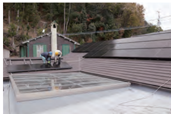
2020年幼稚園屋上に太陽光パネルが完成